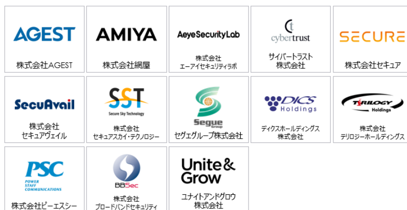
L.P. として参画するセキュリティ企業一覧（50音順）